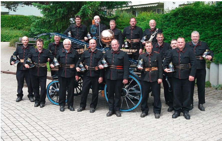
Die Nostalgie-Feuerwehr Mirchel in Oberägeri.

14 Tage später reisten wir nach Deutschland (Engen). Dort erkämpften wir uns den 3. Rang. Am 9. Juli 2011 führte Bowil den Emmentalischen Handdruckspritz Plausch-Wettkampf mit Gästen durch. Dort konnten wir den 1. Platz belegen. Es war ein sehr erfolgreiches Jahr für den jungen Verein.